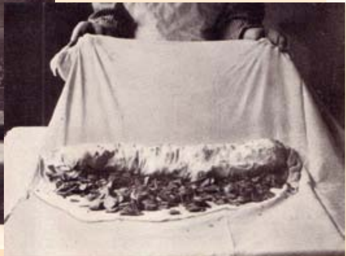
Das Zusammenrollen eines Apfelstrudels. Siehe Nr. 919.

Zusatzstoffe: 1: mit Farbstoff | 2: mit Konservierungsstoff | 3: mit Antioxidationsmittel | 4: mit Geschmacksverstärker 5: mit Schwefeldioxid | 6: geschwärzt | 7: mit Phosphat | 8: mit Pökelsalz | 9: koffeinhaltig | 10: Chininhaltig 11: mit Süßungsmittel | 12: enthält Phenylalaninquelle | 13: gewachst | 14: enthält Alkohol