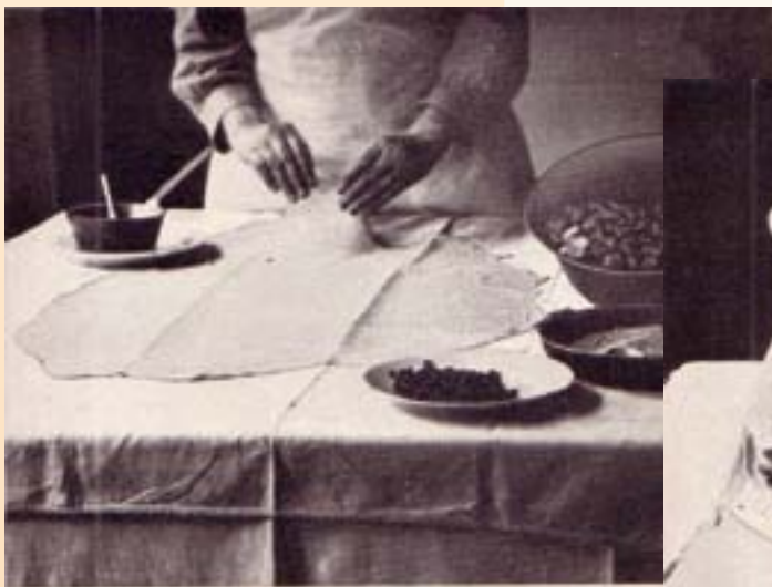
Das Ausrollen des Strudelteiges. Siehe Nr. 919.

Helene ist nicht nur die älteste Bahn, Helene hieß auch meine Uroma und Sie war die Königin der Süßspeisen.